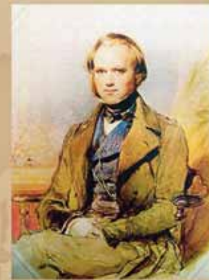
Ч. Дарвин в 1839 г. Худ. Джордж Ричмонд

Так закончился бал нашей Золушки-Фуэгии. В прошлом остались и прием у королевы, и поездка в карете по Лондону, и неспешные прогулки с Дарвином по Риоде-Жанейро. Фуэгия помахала рукой капитану и оста-