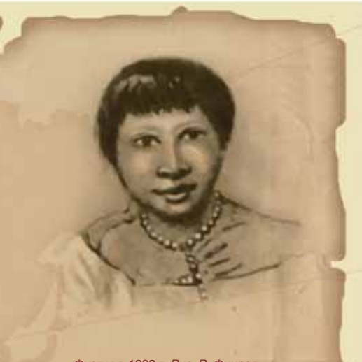
Фуэгия в 1833 г. Рис. Р. Фичроя

Корабль Его Величества «Бигль» вышел в свое историческое плавание 27 декабря 1831 года под ко-