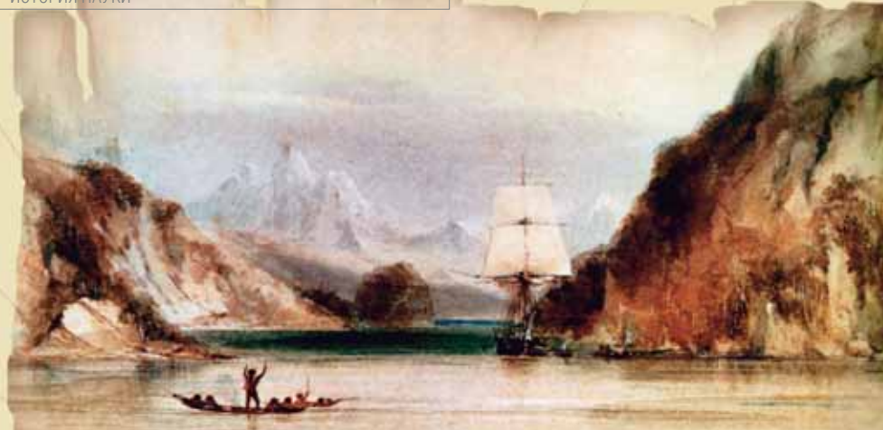
«Бигль» в проливе Мюррея

коз тебе, ни бананов, а вместо доброго друга Пятницы злобные огнеземельцы. И то верно: в таком месте даже у милейшего человека безнадежно портится характер.