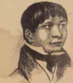
Джемми Баттон. Рис. Р. Фицроя

Бухта Ботафого в Рио-де-Жанейро, где жили Дарвин и Фуэзия