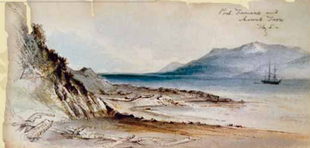
Порт Голода, где застрелился капитан Стокс

ему отдать приказ, чтобы из трупа бедняги приготовили скелет для «будущих исследований». Кто знает, может и сейчас этот скелет хранится в Лондоне в Музее естественной истории. (Музей, кстати, расположен недалеко от российского посольства, будете поблизости — поинтересуйтесь.)