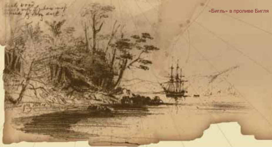
«Бигль» в проливе Бигля

В начале XIX в. в Южной Америке пошла мода на независимость, и вся испанская империя развалилась на кучу республик. Мы-то с вами хорошо знаем, что следует за независимостью: хозяйство немедленно приходит в полный упадок, а независимые государства сразу же начинают ссориться с соседями. Чилийские