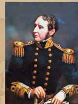
Р. Фицрой в 1865 г. Худ. Френсис Лейн

В одно прекрасное утро наши моряки проснулись на необитаемом острове и обнаружили, что их единственное плавсредство уплыло в неизвестном направлении. Они соорудили из веток корзину, обтянули ее парусиной и послали на этом суденышке гонцов на «Бигль». Глубоко за полночь добрались гонцы до корабля и доложили о происшествии разъярившемуся капитану. Фицрой немедленно снарядил спасательно-карательную экспедицию. В течение 18 суток, последовавших за этой бурной ночью, моряки занимались поисками вельбота.